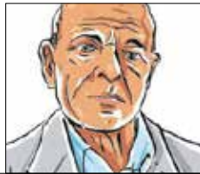
redaguje Eustachy Przepadek

musi podjąć decyzję, którą nogą. Masz dwie – musi wybrać. Wybór świadomy następuje wtedy, gdy uruchamiamy korę mózgową odpowiedzialną za racjonalne myślenie. Aby tego dokonać, nie możemy dać się rozchwiać emocjonalnie, ponieważ wtedy pracujemy w trybie automatycznym. Wiedzą o tym specje od reklamy, politycy i spin doktorzy, co pozwala im sterować naszymi decyzjami. Wybór świadomy jest trudny, ponieważ niesie za sobą ryzyko popełnienia błędu. Brak wyboru jest też wyborem (oddaliśmy prawo do decyzji innemu). Skutki tych decyzji będziemy ponosić my. Dlatego, Czytelniku, idź na wybory i wybieraj. Poczuj się jak pan, który wraz z innymi współobywatelami będzie wybierał służących. Wszak to politycy twierdzą, że ich rolą jest służenie społeczeństwu. A po wyborach nie daj sobie wmówić, że jest odwrotnie. A tymczasem bardzo dziękuję za żywe i miłe listy od Was drodzy czytelnicy. I dziękuję za te cztery lata współpracy. Szkoda, że ta przygoda się już kończy. Pozdrawiam Was. ■