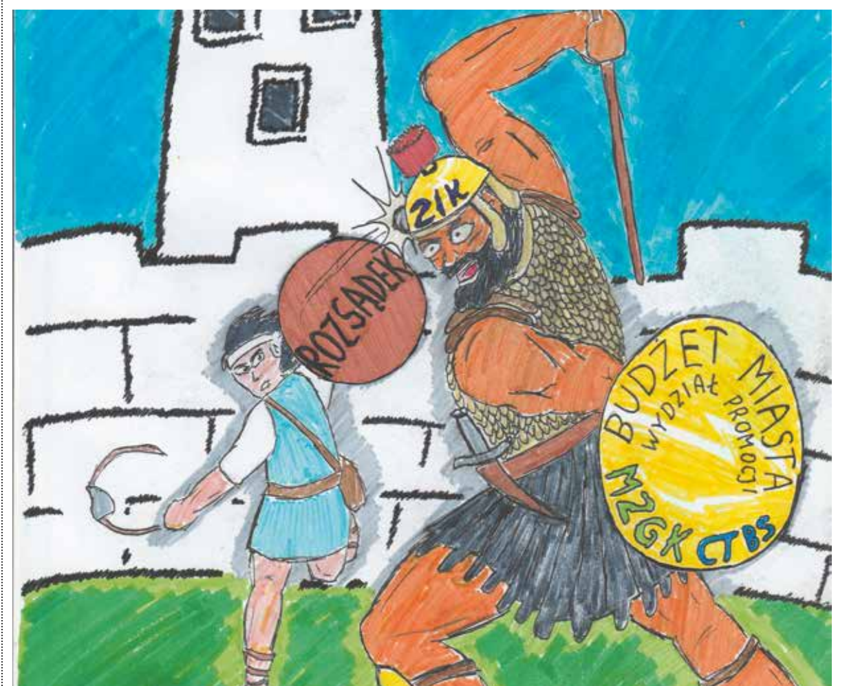
RYS: PIOTR ZIEBA